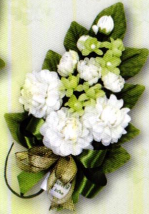
3 ช่อมะลิ "ร้อยรวมรัก" ราคา 50.- บาท