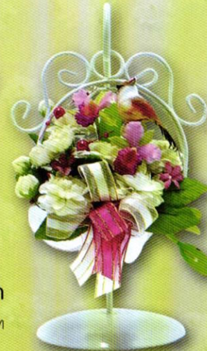
10 กระเช้าน้อย...ร้อยรัก ราคา 320.- บาท