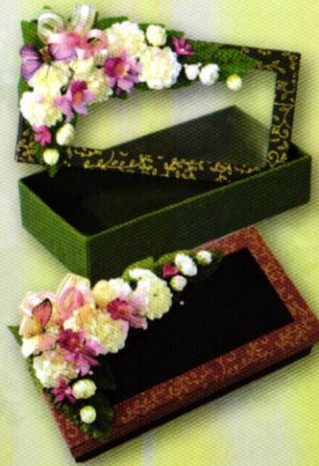
9 กล่องมะลิ...สิริรัก ราคา 320.- บาท