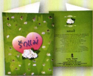
4 บัตรอวยพร...ส่งรักให้แม่ ราคา 50.- บาท