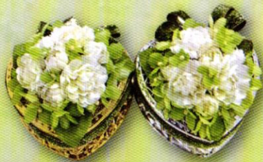
5 กล่องหัวใจ...ใส่รัก ราคา 160.- บาท