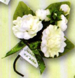
2 ช่อมะลิ "รวมใจรักแม่" ราคา 20.- บาท