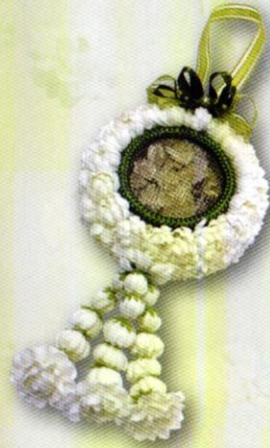
7 โมบายบุหงา...ฝากรักแม่ ราคา 300.- บาท