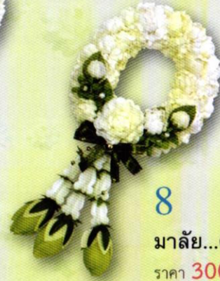
8 มาลัย...คล้องใจแม่ ราคา 300.- บาท