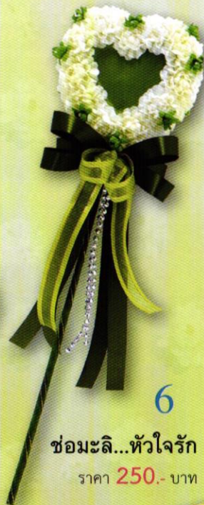
6 ช่อมะลิ...หัวใจรัก ราคา 250.- บาท